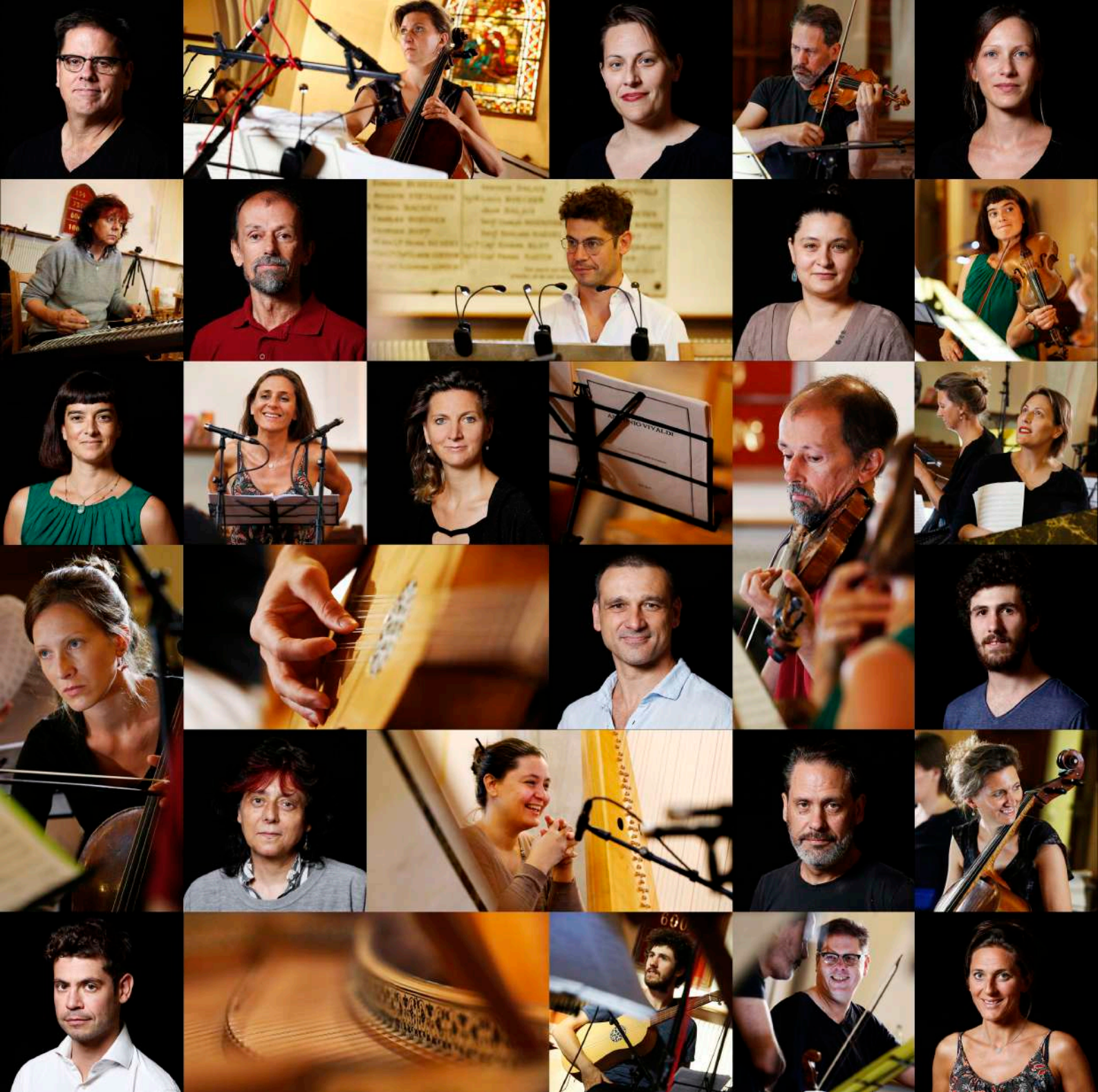
Graphisme Motifcreation-Utographie